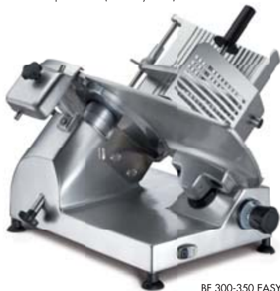
BF 300-350 EASY