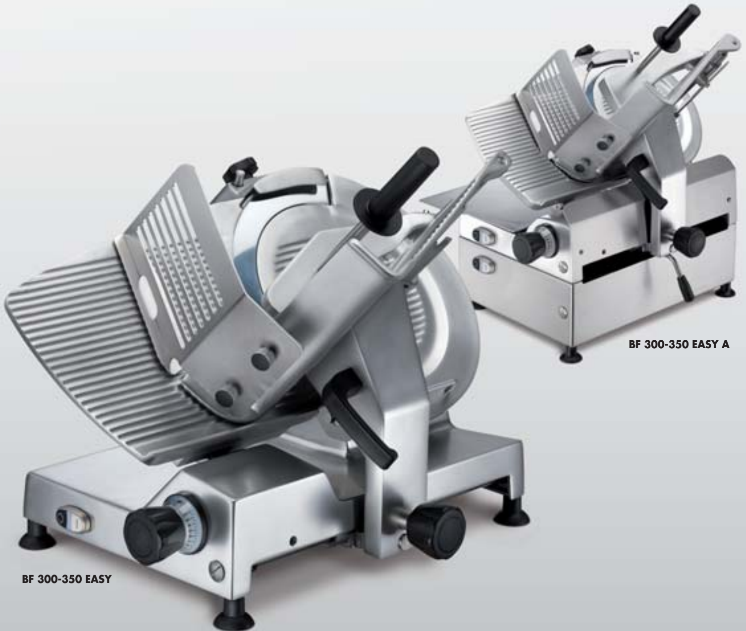
BF 300-350 EASY